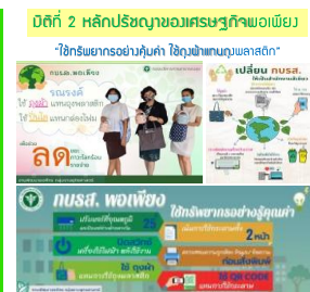
รายงานผลการจัดกิจกรรม (ที่เพิ่มเติมจากแผนปฏิบัติการส่งเสริมคุณธรรม )