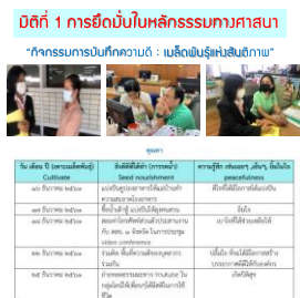
รายงานผลการจัดกิจกรรม (ที่เพิ่มเติมจากแผนปฏิบัติการส่งเสริมคุณธรรม )

ใช้ระบบเครดิตสังคม ถอดบทเรียนบุคลากรที่มีการพัฒนาคุณธรรมโดดเด่น ด้วยการบอกต่อความดี “ชื่นชม แชร์ โห่”